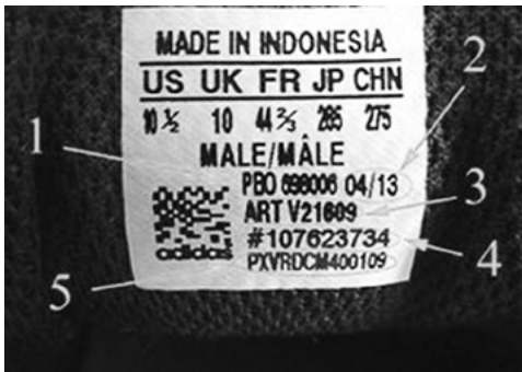
Рис. 3. Бирка оригінальної версії кросівок «Adidas»: 1) фабричний номер; 2) дата виробництва; 3) артикул; 4) код партії; 5) унікальний код

Бирка на кросівках бренда «Adidas» розміщується на тильному боці язичка строго посередині. Інформація на ній, що має бути добре видна, містить обов'язкові елементи, серед яких фабричний номер, дата виробництва, артикул, код партії, унікальний код (рис. 3).