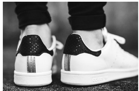
Рис. 4. Стрічки в оригінальній версії взуття

З огляду на те, що з 1994 р., аби збільшити обсяг своєї продукції, компанія «Adidas» перенесла майже все своє виробництво в країни третього світу, напис «Made in China» жодним чином не свідчить про підробку оригіналу, а кросівок з написом «Made in Germany» не-