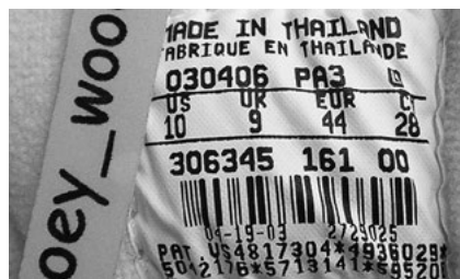
Рис. 13. Внутрішня бирка оригінальної версії кросівок компанії «Nike»

Висновки. Знання особливостей підробок брендового спортивного взуття і тонкощів виробництва компаній «Adidas» і «Nike» сприятиме правильній ідентифікації досліджуваних товарів органолептичним методом. Запропоновані етапи дослідження дають змогу визначити, чи оригінальним є надане на дослідження взуття, уможливаючи пошук аналогів під час встановлення ринкової вартості цих товарів.