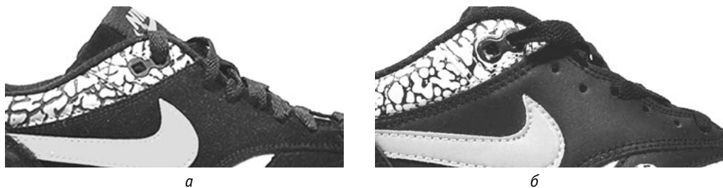
Рис. 12. Отвори в оригінальних (а) та підроблених (б) кросівках

Внутрішня бирка оригінальних кросівок розміщена на задній панелі язичка; її зовнішній вигляд залежить від року випуску кросівок. Важливу роль для ідентифікації оригінальності кросівок відіграють інтервали між даними на бирці: контактні дані (US, UK, EUR, CM) і їх цифрові значення розміщуються впритул одне до одного, а дата випуску – до штрих-коду (рис. 13).