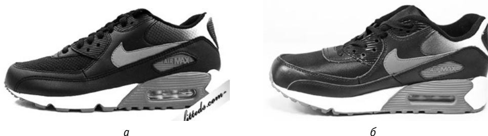
Рис. 9. Оригінал (а) та підробка (б) моделі «Nike Air Max 90 (black-varsity red-metallic silver)»

І хоча під час виготовлення підробки скопійовано колірне рішення моделі та її форму, матеріали для різних деталей кросівок зазвичай використовують зовсім інші (рис. 9).