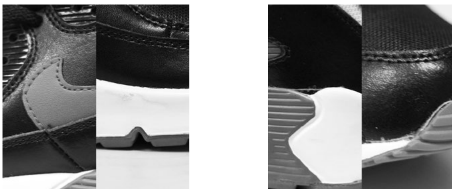
Рис. 8. Підробка моделі «Nike Air Max 90 (black-varsity red-metallic silver)»

Підшва кросівок «Nike» не має бути занадто блискучою, «пластмасовою» та слизькою, а шар із піни (якщо такий передбачено) не може замінюватися на шматок пластика або гуми. Запах хімічних речовин також засвідчує підробку.