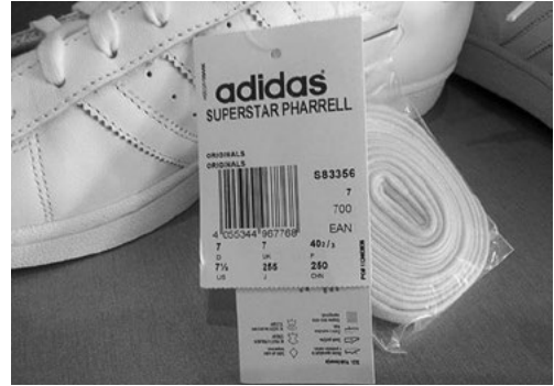
Рис. 2. Додаткова пара шнурівок в оригінальній версії «Adidas»

Відрізнити підробку від оригінальних кросівок «Adidas» можна і за якістю використаних для їх виготовлення матеріалів.