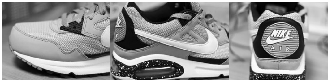
Рис. 7. Оригінальна модель «Nike Air Max Skyline SI»

Отже, рівний шов, акуратно пришиті ярлики, відсутність задирок і плям клею, а тим більше засохлих його крапель – це мінімум якостей, чому мають відповідати оригінальні кросівки (рис. 7 і 8) ( Kak otlichit nastoiashchii NIKE ).