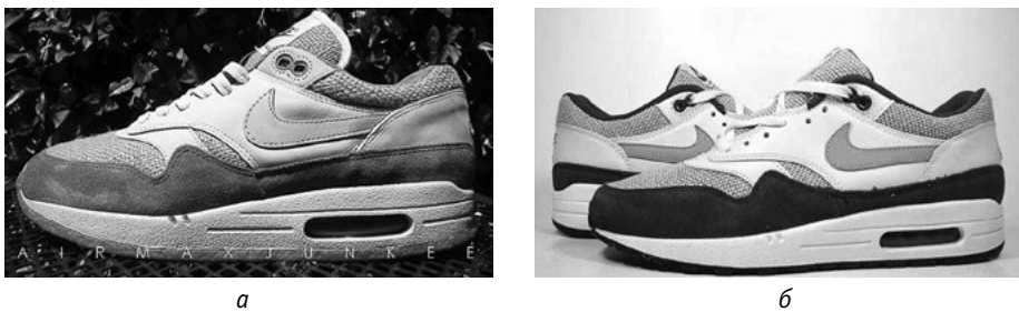
Рис. 11. Оригінальні (а) та підроблені (б) кросівки «Nike Air Max»

Оригінальність кросівок можна перевірити і за кодом, який зазначають на внутрішньому ярлику. Складається він із 9 цифр (6 і наступні 3 розділені знаком «-»). Задаючи умови пошуку за цим кодом, можна знайти зображення потрібної моделі кросівок і порівняти його з об'єктом дослідження. Якщо колір елементів відрізняється, кросівки із зазначеним на внутрішньому ярлику кодом є підробкою (рис. 11) ( Kak otlichit poddelnyye krossovki ).