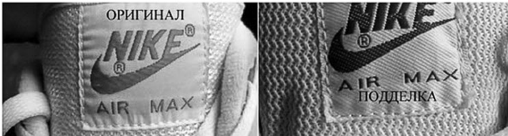
Рис. 6. Бирки на оригінальному (а) та підробленому (б) взутті марки «Nike»