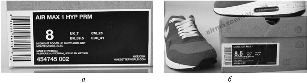
Рис. 10. Упаковка оригінальних (а) та підроблених (б) кросівок «Nike»

Колір коробки, як і етикетки, розміщеної на ній, залежить від моделі. Більшість сучасних кросівок «Nike Air Max» випускають у коробках коричневого кольору з чорною етикеткою (етикетка прилягає до лівої нижньої частини коробки). Більшість кросівок «Nike Air Max» у чоловічих розмірах, тому «Nike» не використовує термін «Mens» у назві моделі (рис. 10).