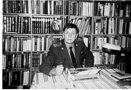
У власній бібліотеці; «Ні дня без рядка!»