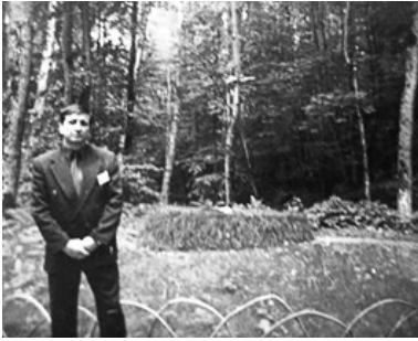
Ясна Поляна. Біля могили Л. М. Толстого. 2003 р.