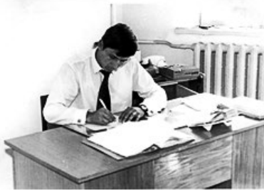
Слідчий Краснолуцького РВВС. 1973 р.

Уже через два роки молодого слідчого було визнано «Кращим слідчим Ворошиловградської області 1974 року» – він завершив і скерував до суду упродовж року 90 кримінальних справ. Перед направленням на навчання до Київської вищої школи (КВШ) МВС СРСР (1975 р.) він навіть виконував обов'язки начальника слідчого відділення райвідділу.