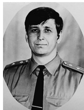
Ад'юнкт КВШ. 1983 р.