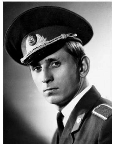
Курсант ДССШМ. 1971 р.

Обрати міліцейську професію майбутнього вченого спонукали книжки із сімейної бібліотеки, серед