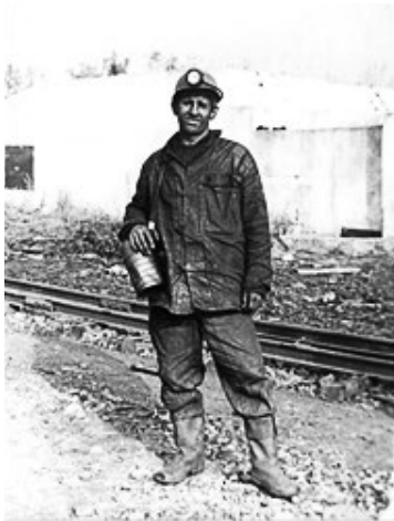
Кріпильник шахти «Садово-Хрустальська». 1969 р.

яких чимало пригодницької літератури – юнак із захопленням читав про пригоди Шерлока Холмса Конана Дойла, «Записки слідователя» Льва Шейніна, «Один год» Юрія Германа, оповідання Едгара По тощо.