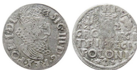
Рис. 246 [126, с. 208, № N.22.1.a]