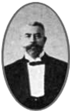
В. І. Лебедєв (1868–1930)

місцевими засобами інформації. Зокрема й на сторінках столичної щотижневої юридичної газети-журналу «Право», матеріали якої покладено в основу цього дослідження.