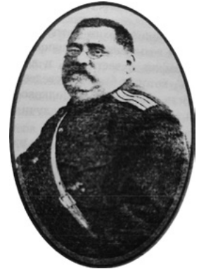
К. Г. Прохоров

На сторінках журналу він жваво дискутував із відомим криміналістом, доктором медицини К. Г. Прохоровим – прихильником поліцейської антропометрії в поєднанні з дактилоскопією, а також із судовою фотографією, яку вважав невід'ємною частиною криміналістичних методів реєстрації злочинного елементу (Prokhorov, 1913a, 1913b). Жабчинський, у свою чергу, пропонував ліквідувати в Росії антропологічну систему, замінивши її дактилоскопією. При цьому Михайло Олександрович стверджував, що антропометрію А. Бертільйона і «словесний портрет» Рейсса необхідно викинути за борт, оскільки ці методи нині залишені поліціями майже всіх держав, крім Росії (Zhabchinskii, 1913, s. 137).