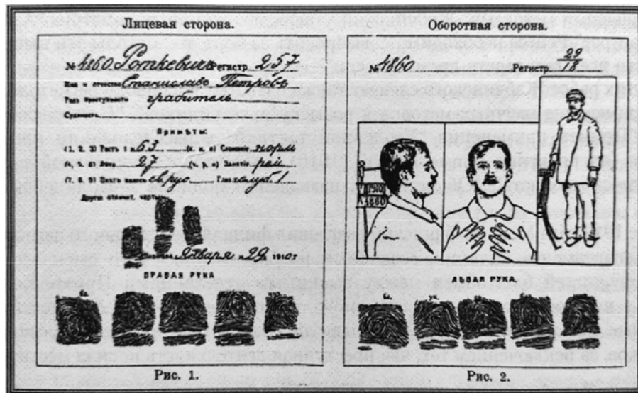
Картка спрощеної системи реєстрації злочинців