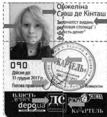
Рис. 3. Суміщення зображень досліджуваного документа (ліворуч) і зразка (праворуч)

Примітка. Барвником синього кольору позначені розбіжності, червоного – збіжні ознаки. Кольорову гаму рисунка можна спостерігати в електронній версії наукової статті ( https://visnyk.dndekc.mvs.gov.ua/index.php/visnyk )