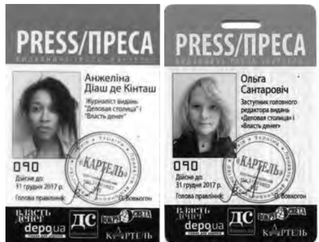
Рис. 2. Загальний вигляд досліджуваного документа (а), зразка (б)