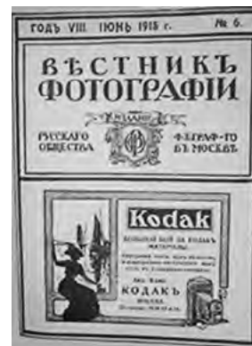
Обложка журнала «Вестник фотографии», июнь 1915 г.