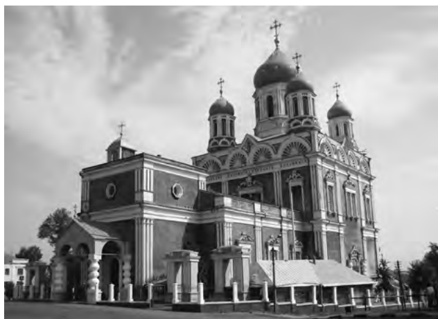
Вознесенский собор, Елец